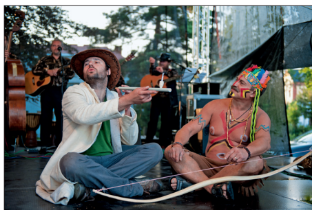
Lidová veselice Hanácké pupek světa